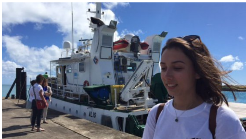
Des jeunes universitaires calédoniens vont participer à la mission Kanacono

C'est à bord de l'Alis, navire de l'IRD, que 6 scientifiques vont naviguer autour de l'île des pins jusqu'à la passe de Norfolk. Ils vont collecter des espèces négligées comme les mollusques, crustacés ou invertébrés marins. A terre une deuxième équipe va faire le tri des découvertes.