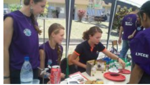
Fête de la science à Touho: et pourquoi pas des grillons dans nos assiettes?