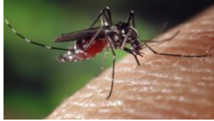
L'arbovirose au coeur de la deuxième journée scientifique internationale de l'institut