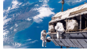
La station spatiale internationale dans le ciel calédonien!