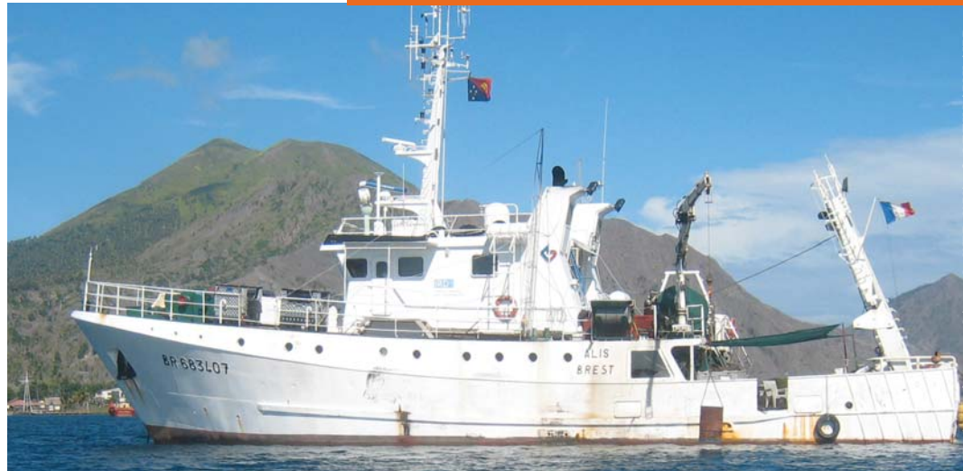
Navire océanographique de l'IRD, l'Alis