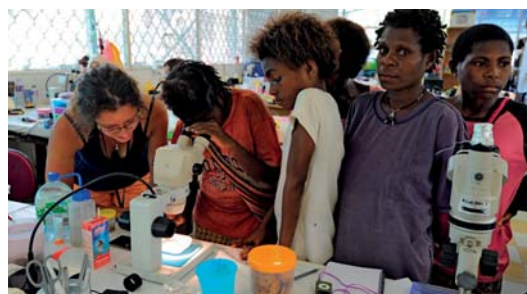
Visite de classe à Kavieng, Papouasie Nouvelle-Guinée. Les expéditions en Papouasie Nouvelle-Guinée ont été l'occasion d'établir des liens avec la Nouvelle-Calédonie, notamment via des échanges étudiants .

Sur place, deux étudiants de l'Université de Nouvelle-Calédonie participeront à la mission pendant les deux premières semaines (tri, prélèvements de tissus, fixation des spécimens). De nombreuses animations à destination des scolaires seront menées par l'association de professeurs Symbiose pendant les deux premières semaines à l'île des Pins, avec notamment au programme des visites du laboratoire et du navire océanographique et des ateliers sur la découverte du milieu marin. L'accent sera aussi mis sur la création de nombreux supports visuels en vue de leur intégration aux futures visites du Vaisseau des Sciences Biodiversité.